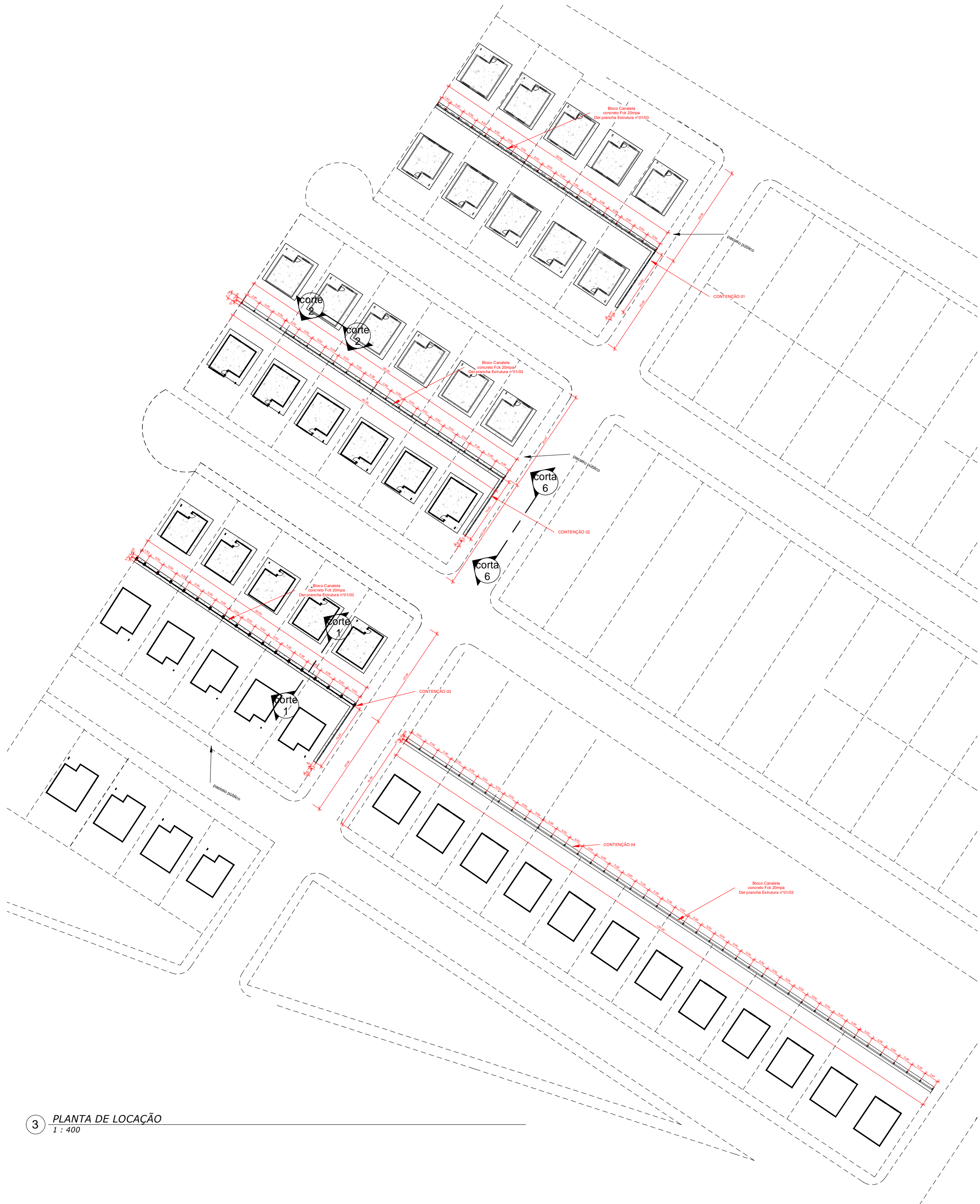
3 PLANTA DE LOCAÇÃO 1 : 400